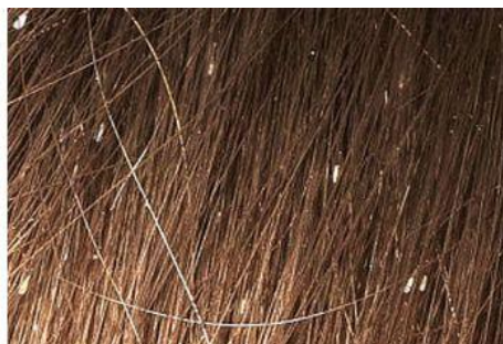
Foto van neten in het haar. Deze zitten vast aan de haren. Die veeg je niet weg, zoals zand.

Een hoofdluis ziet er in de ontwikkeling steeds anders uit.